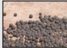
Earth or Mars?